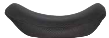
Attivo - profondità 6 cm