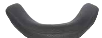
Avvolgente - profondità 10 cm