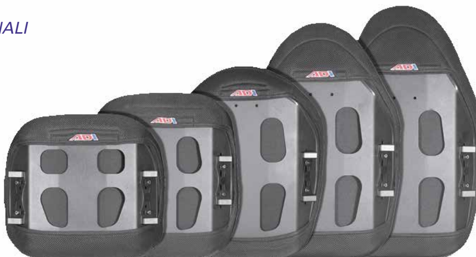
Basso - 25 cm Medio - 33cm Standard - 40 cm Alto - 46 cm XAlto - 51 cm