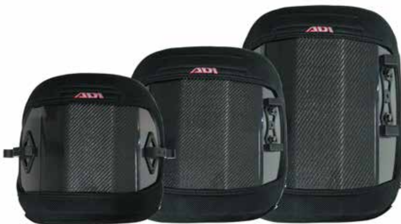
Basso - 25 cm