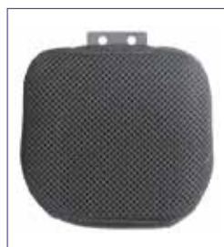
Large (hxp) 11,5 cm x 11,5 cm