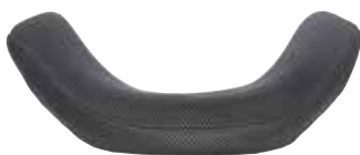
Avvolgente - profondità 10 cm