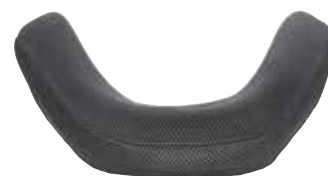
Extra-avvolgente - profondità 15 cm