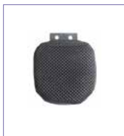
Small (hxp) 7,5 cm x 7,5 cm

Gli schienali ADI in alluminio possono essere accessoriati con spinte laterali in caso l'utente necessiti di un maggior supporto al tronco. Possono essere richieste sia fisse che swing away e sono disponibili in 3 grandezze: