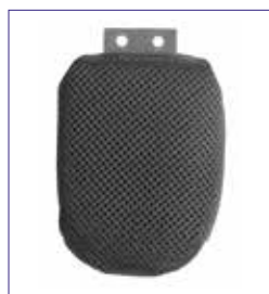
Medium (hxp) 7,5 cm x 10 cm